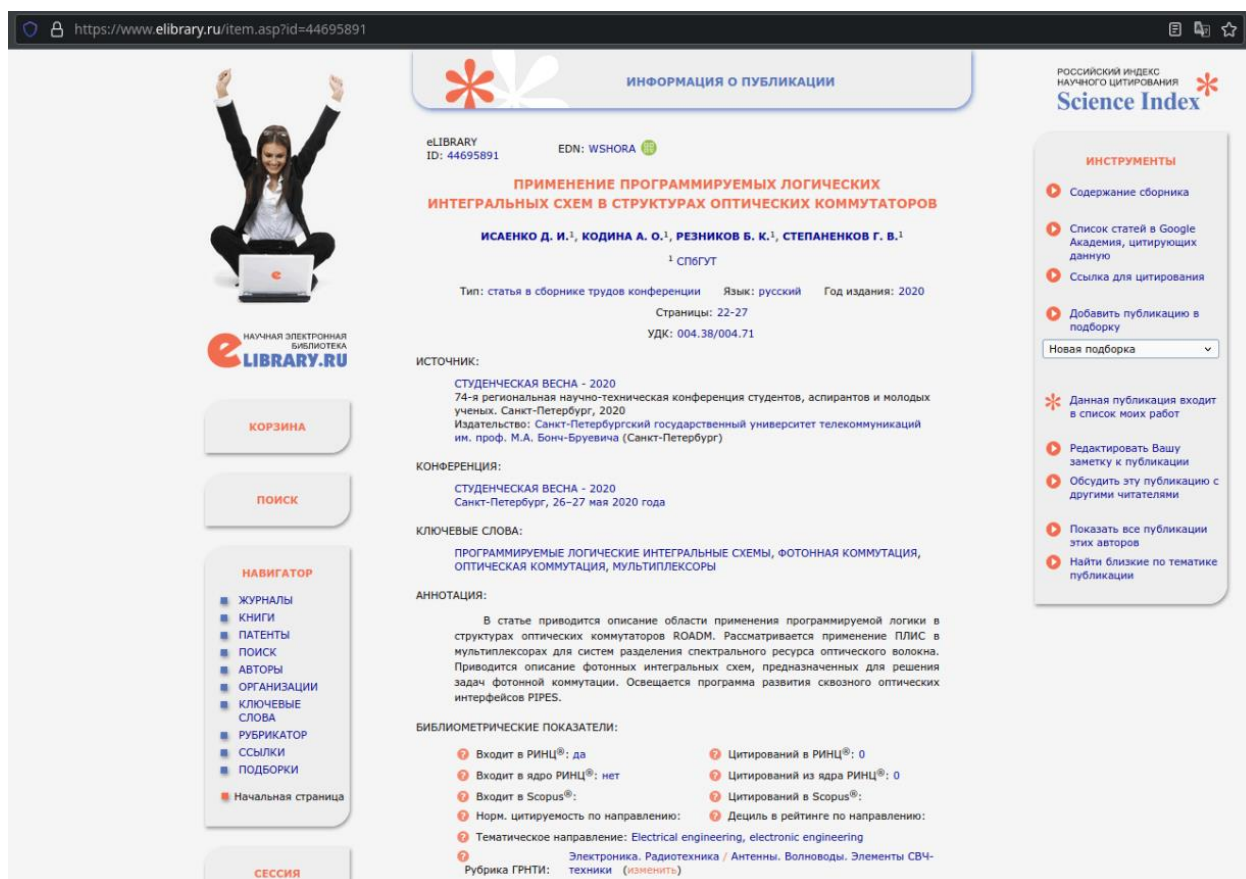
Рис. 1. Пример снимка экрана с сайта elibrary.ru для подтверждения того, что публикация индексируется в РИНЦ

1.2. Файл для подтверждения индивидуального достижения «Тезисы докладов на конференции» должен содержать следующую информацию: сканы обложки, второй страницы, оглавления издания, в котором опубликованы тезисы; – сканы страниц сборника с тезисами.