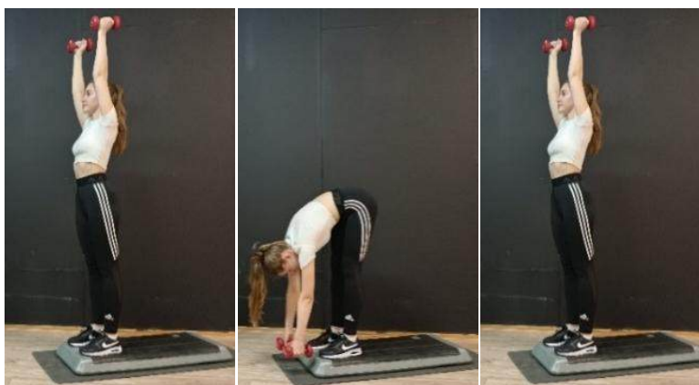
Рис.1 – Наклон вперед в узкой стойке на степ-платформе

Комплексный метод предусматривает рациональное сочетание повторных движений и удержания статических положений как активного, так и пассивного характера. Как правило данный метод реализуется через применение комплексных упражнений [10]. На рисунках 1 и 2 приведен вариант такого комплексного упражнения на степ-платформе с гантелями. Из исходного положения узкой стойки на конце степа поперек, гантели вверх занимающийся сначала выполняет наклоны вперед с движением гантелей вниз к носкам ног, а затем – наклоны вперед с фиксацией по 6 с., удерживая гантели внизу носков ног.