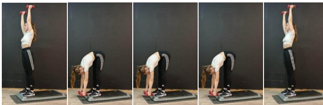
Рис. 2 – Наклон вперед с фиксацией в узкой стойке на степ-платформе

По мнению некоторых авторов комплексный метод является наиболее эффективным для развития гибкости и подвижности в суставах [6, 10]. Он может успешно применяться на занятиях по физической культуре в различных, в том числе и более сложных модификациях. Например, сначала занимающийся выполняет динамичные пружинящие наклоны вперед из положения седа на полу (ноги прямые и вместе) до касания пальцами носков ног (12-16 раз), затем эти же наклоны выполняются с помощью усилий партнера, который стоя сзади при каждом пружинящем движении активно надавливает на спину двумя руками (16-20 раз); после этого выполняется наклон вперед с самозахватом ног и удержанием этого статического положения (8-10 с); завершается комплексное упражнение фиксацией статического наклона на максимальной амплитуде с воздействием партнера на спину.