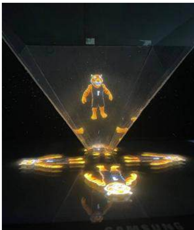
Fig. 1. The operational pseudo-holographic pyramid displaying the animated "Bonch Tigers" mascot

produced essential material maps including Albedo for base color, Roughness for surface glossiness, and Normal for simulating detailed surfaces. These maps ensured realistic material response under the pyramid's reflective conditions. Then a seamless 360-degree rotation in Blender was established, rendering the scene with Cycles path-tracing at Full HD resolution and 30 frames per second. HDRI lighting simulated natural environmental lighting for authentic reflections. The process yielded four video sequences showing the rotating tiger from cardinal directions. Using a 3-mm transparent acrylic pyramid selected for optical clarity, the videos were composited into a cross-pattern ensuring perfect synchronization. When played on a horizontal tablet, the system produced a striking illusion of a colorful, animated 3D tiger floating within the pyramid (Fig. 1).