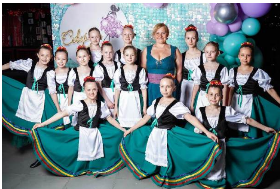
Рис. 3 – Автор и участницы детского танцевального коллектива в костюмах

и выше; участники исторической реконструкции из числа членов клубов и фестивалей; танцевальные и театральные коллективы (рисунок 3); конкурсантки и участницы светских мероприятий.