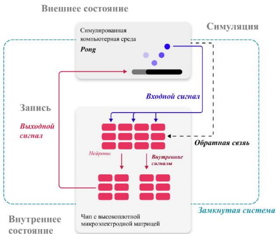
Рис. 1. Архитектура замкнутой гибридной системы биокомпьютера CL1 .

Прямой канал передает данные из внешней среды нейронам. Симулированная компьютерная среда генерирует текущие внешние состояния – например, координаты мяча и положение ракетки в игре. Эти дискретные параметры преобразуются в паттерны электрических стимулов, которые через микроэлектроды чипа подаются на живую нейронную сеть. Нейроны воспринимают эти стимулы как афферентные сигналы, вызывая деполяризацию мембран и генерацию потенциалов действия. Так внешние события кодируются в нейронную активность, формируя внутренние состояния сети.