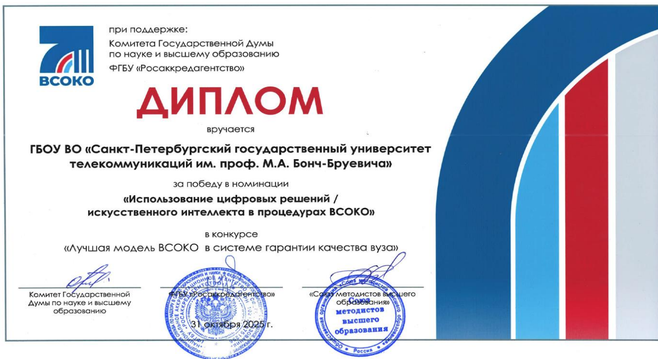
Рис. 2. Диплом за победу в номинации «Использование цифровых решений / искусственного интеллекта в процедурах ВСОКО»

Всероссийский конкурс «Лучшая модель ВСОКО в системе гарантии качества вуза» был учреждён Университетской национальной инициативой качества образования, Общественной организацией «Союз методистов высшего образования» и проводится при поддержке комитета Государственной Думы Российской Федерации по науке и высшему образованию и ФГБУ «Национальное аккредитационное агентство в сфере образования».