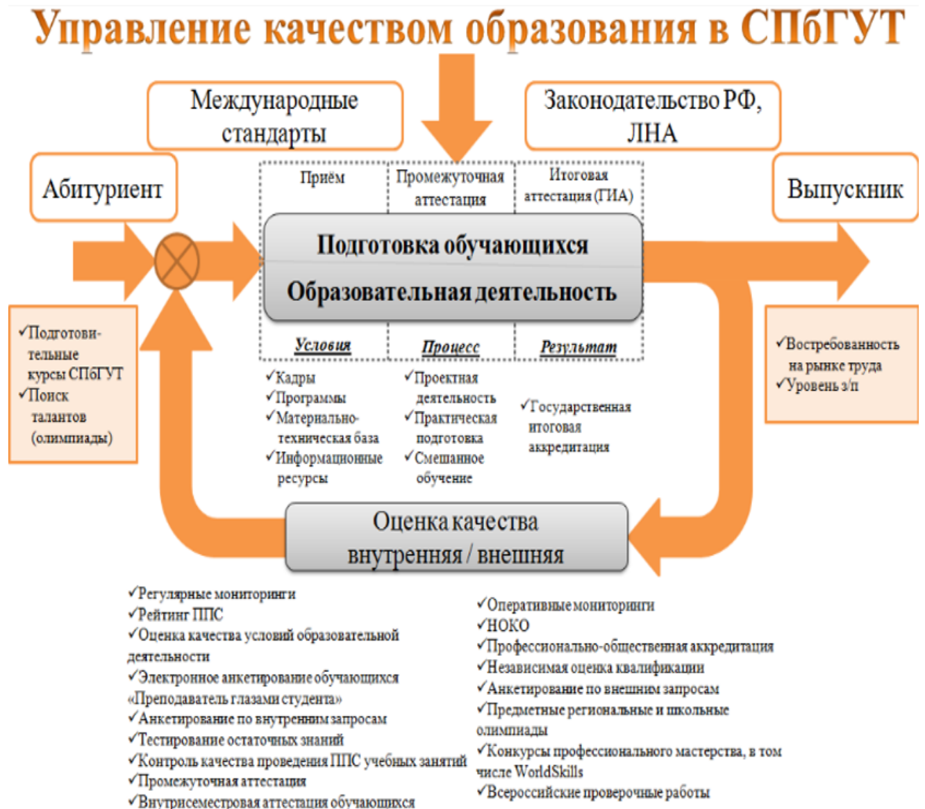
Рис. 1. Система оценки качества образовательной деятельности и подготовки обучающихся

Подробнее об оценке качества образования в СПбГУТ можно узнать на сайте университета: https://www.sut.ru/university/oko-spbgut .