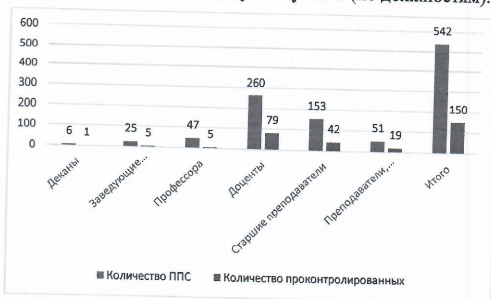
График 2 – Количество проконтролированных преподавателей

На графике 2 отражено количество проконтролированных преподавателей по отношению к общему числу ППС (по должностям).