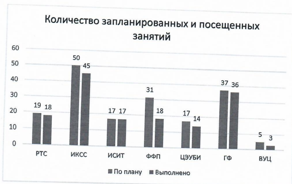
График 1 – Количество запланированных и посещенных занятий по факультетам

В 1 семестре 2019-2020 учебного года из 176 контролей посещено 151 занятие. Шесть факультетов имеют задолженности. Наиболее наглядно итоги выполнения плана контроля учебных занятий факультетами представлены на графике 1.