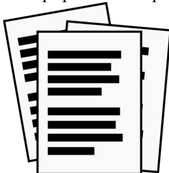
Рисунок 1.1 – Наименование

На рисунке 1.1 проиллюстрирован конкретный пример.