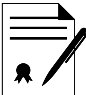
Рисунок 2 – Наименование

Важно правильно оформлять документы (Рисунок 2).