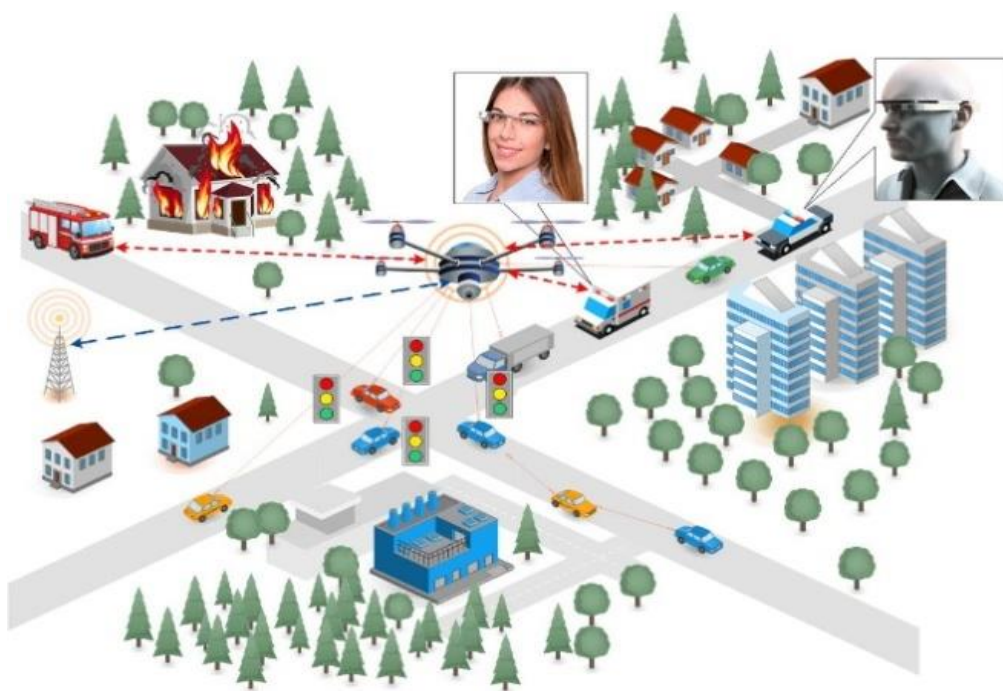
Рисунок 4.17 - Архитектура взаимодействия сетевых элементов

В данном разделе рассматривается модель управления светофорами при наличии приоритетного обслуживания. Приоритетное обслуживание означает, что существует кластер автомобилей, который движется с постоянной скоростью и для которого на протяжении маршрута его движения должно быть обеспечено нахождение светофоров на перекрестках в состоянии беспрепятственного проезда этого кластера автомобилей как показано на рисунке 4.17.