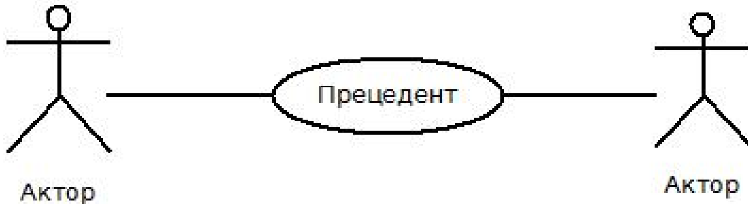
Диаграмма Use Case