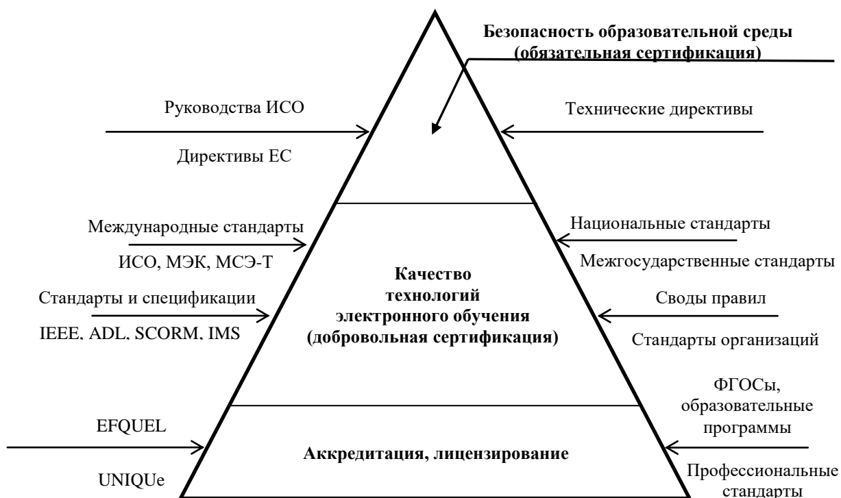
Рисунок 1.2. Гармонизация нормативной базы в области ИКТО

В России уже более 10 лет существует технический комитет, активно работающий в области единых подходов технологий электронного обучения, и уже создана реальная база стандартов для индустриального развития электронного обучения, обеспечения гарантий качества и безопасности в нашей стране. Нормативная база в области ИКТО представлена на рис. 1.2. В левой части пирамиды представлены документы международного уровня. В правой части – национального уровня.