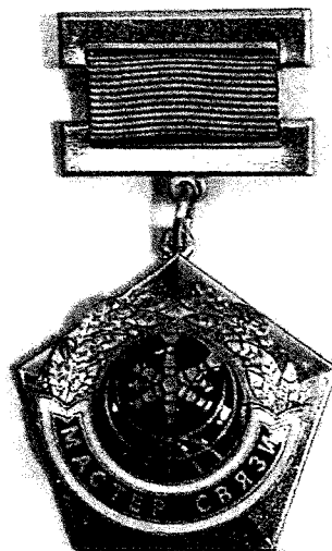
Рисунок нагрудного знака к званию «Мастер связи»