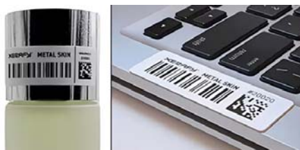
Рис. 5. Метка Xerafy Metal Skin