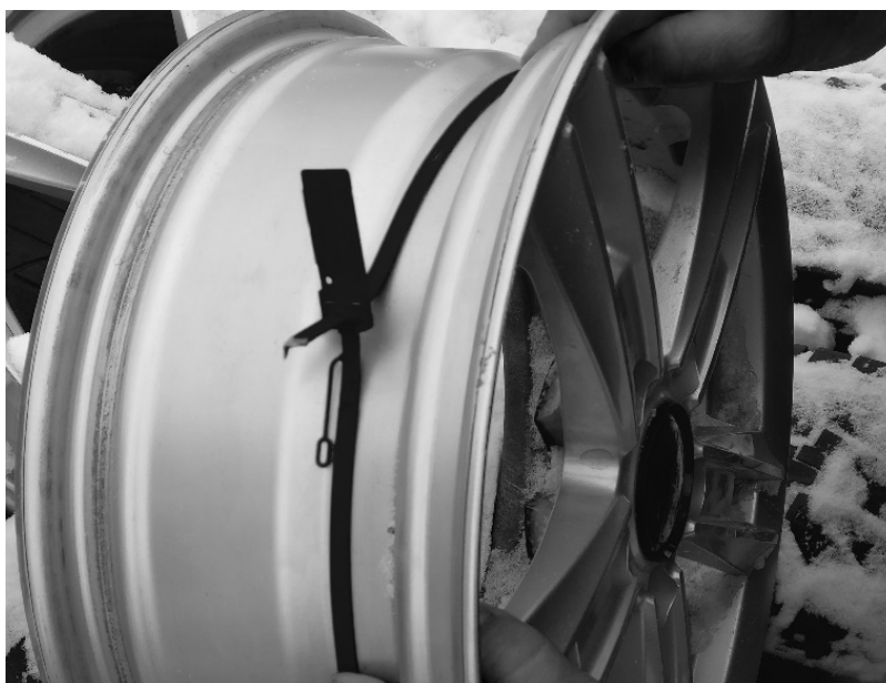
Рис. 9. RFID-пломба для маркировки колёсных дисков