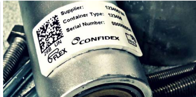
Рис. 2. Метка на гибкой подложке из вспененного полиэтилена

Другое решение состоит в применении меток в виде флажков, как показано в патенте на полезную модель № 188262 [4].