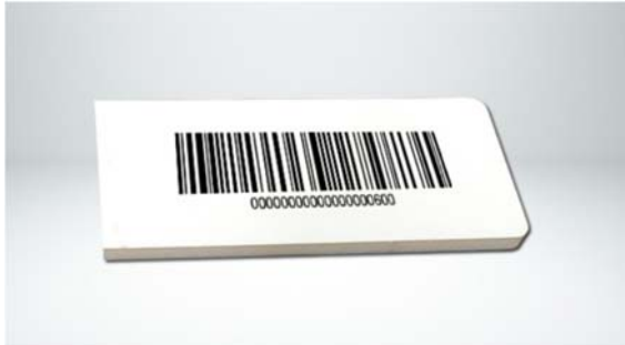
Рис. 1. Метка на твёрдой подложке

Наиболее простое решение по RFID-маркировке металлических объектов состоит в креплении метки не непосредственно на металл, а на жёсткую диэлектрическую подложку из твёрдого пластика (рис. 1) либо на гибкую из вспененного полиэтилена (рис. 2). Из практики известно, метка, установленная с зазором 2–3 мм от металла, уже может быть считана.