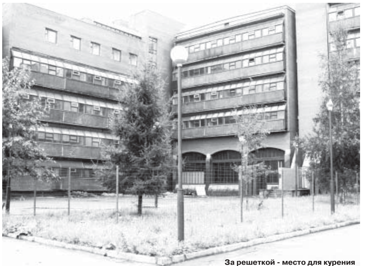
За решеткой - место для курения